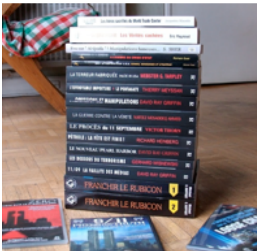
Ma bibliothèque "11 septembre", où seul le Raynaud reste à lire.